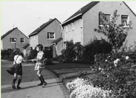
Lauritz Lauritzen Bundeswohnungsbauminister, 1966–1972

Unter modifizierten Kriterien und dem entsprechenden neuen Titel „Familienwohnung und Familienheim“ wurde dieser Wettbewerb auch für die Jahre 1980/81 und 1983/84 vom Bundesbauminister ausgeschrieben. Das Ziel war, zunächst zu zeigen, wie Mehrfamilienhäuser und Einfamilienhäuser in städtebaulichem Zusammenhang sinnvoll einander zugeordnet werden können. Der Wettbewerb danach hatte die Schwerpunkte „Mehrere Generationen unter einem Dach“ und „Jedes Haus prägt die Stadt mit“. Die Durchführung der Wettbewerbe oblag dem Verband und wurde von der Verbandszeitschrift „Familienheim und Garten“ ausführlich redaktionell begleitet.