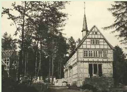
Schulungsgebäude des Siedlungslehrhofs Hohemark, Oberursel.

Die Kleinsiedlung in der uns geläufigen Form entstand ihrem Wesen nach mit der dritten Notverordnung vom 6. Oktober 1931. Mit dieser Notverordnung sollten in der Weltwirtschaftskrise die Arbeitslosen von den Straßen geholt und einer sinnvollen Tätigkeit zugeführt werden. Weiterhin sollte es den Menschen ermöglicht werden, ihren Lebensunterhalt zu einem großen Teil aus der Bewirtschaftung ihres eigenen Grund und Bodens zu bestreiten. In den wirtschaftlich schweren Zeiten,