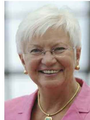
Gerda Hasselfeldt MdB

ifs – Institut für Städtebau, Wohnungswirtschaft und Bausparwesen