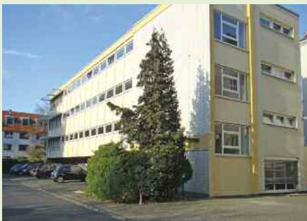
Bonn, Neefestraße 2a: Von 1988 bis 2009 beherbergte die dritte Etage die Räume der Bundesgeschäftsstelle und des Verlags „Fami- lienheim und Garten“.

Seit Sommer 2009 sitzen die Bundesgeschäftsstelle und die Familienheim und Garten Verlagsgesellschaft mbH in der neuen, repräsentativen Zentrale, Oberer Lindweg 2, Bonn.