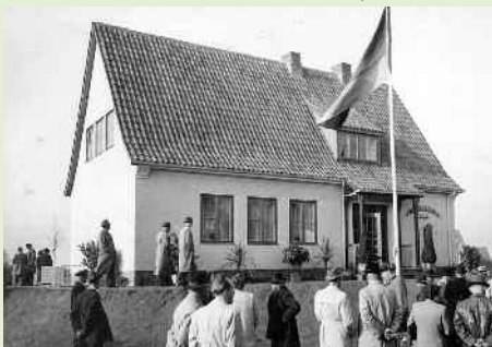
Siedlerschule Neumünster, 1953.

Um ihren Aufgaben gewachsen zu sein, mussten die Siedlerfamilien damals vor allem während der Bauphase, aber auch im Anschluss hieran bezüglich der Gartenbewirtschaftung beraten und betreut werden. Diese Betreuung wurde zunächst durch die Gemeinden als Verfahrensträger geleistet. Sehr bald wurde jedoch erkannt, dass eine einheitliche Beratung erforderlich war, sodass es schließlich zu einem Zusammenschluss der Kleinsiedler im Jahre 1935 als Deutscher Siedlerbund e.V. kam.