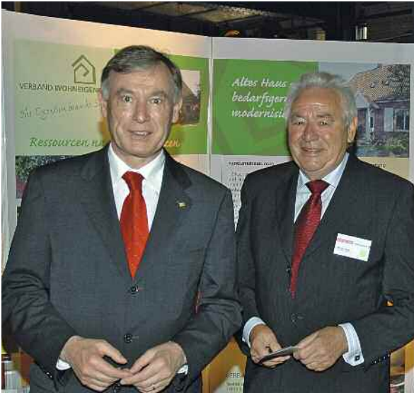
Bundespräsident Horst Köhler und Präsident Alfons Löseke beim 1. Deutschen Verbrauchertag am 9. Juli 2007 in Berlin.

des Eigenheimbestands – in diese renommierte große Verbraucherschutz-Organisation einzubringen, die wiederum in der Öffentlichkeit Position bezieht und gehört wird. Der 1. Deutsche Verbrauchertag, organisiert vom Verbraucherzentrale Bundesverband am 9. Juli 2007, bot die