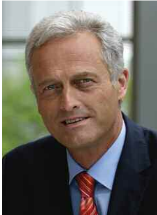
Dr. Peter Ramsauer MdB Bundesminister

Bundesministerium für Verkehr, Bau und Stadtentwicklung