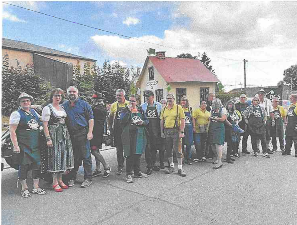
Teilnahme am traditionellen Wiesenfestumzug