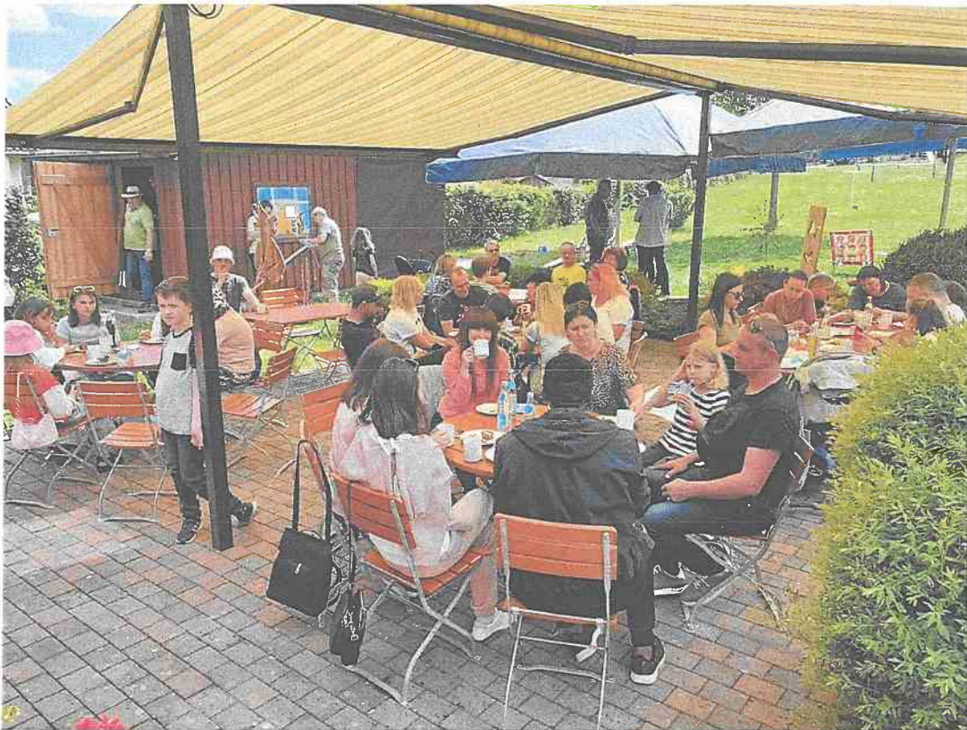
Ukrainische Flüchtlingsfamilien auf der Siedlerterrasse bei Kaffee und Kuchen

Aktuelle Bereitschaft zur Mitarbeit im Helferkreis 2023 (Containerwohnheim entsteht in Schwarzenbach)