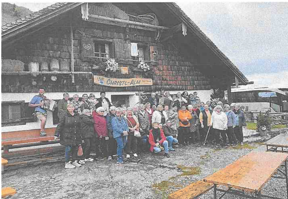
Apfelernte, Siedlerhäuschen und Verwöhn-Wochenende mit Siedlerfrauen und Gästen