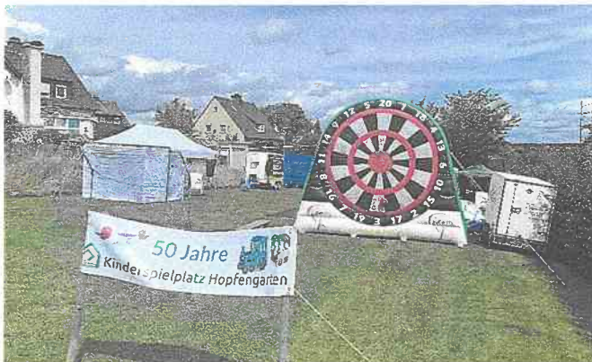
50 Jahre Kinderspielplatz Hopfengarten und Kindergruppe in Aktion