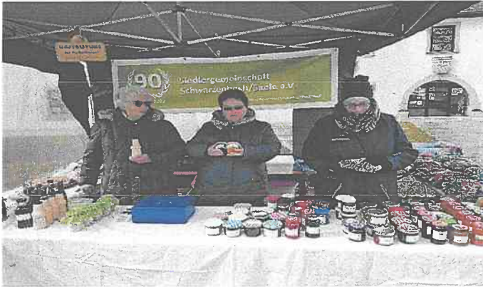
Verkaufsstand und Frauengruppentreffen