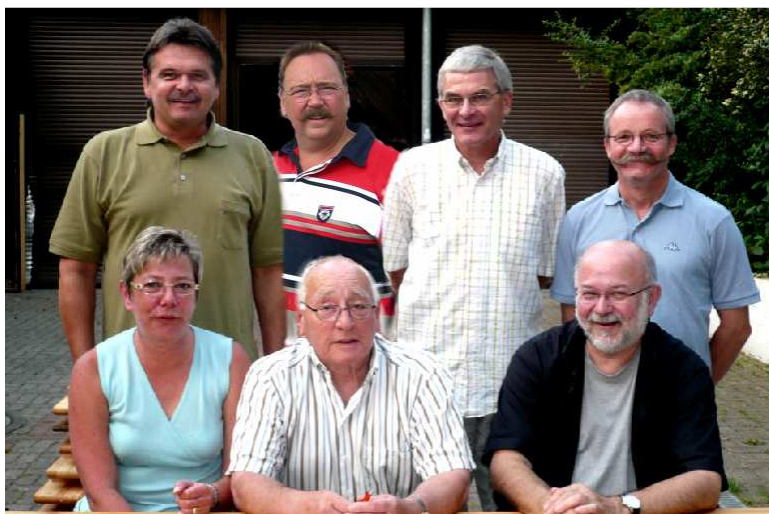
Neuer Vorstand der Siedlergemeinschaft „An der Gräfte e.V.“: