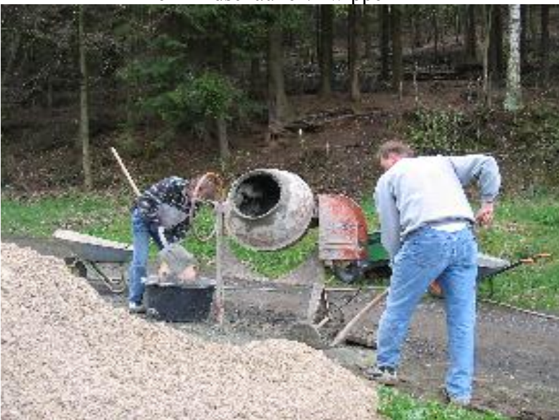
BERND 2 BEIM MISCHEN DES BETONS!

Am Samstag wurde reichlich Beton gemischt und in die vorbereiteten Fundamente eingebracht. Die Geräte wurden an den vorher berechneten Stellen genau eingegossen.