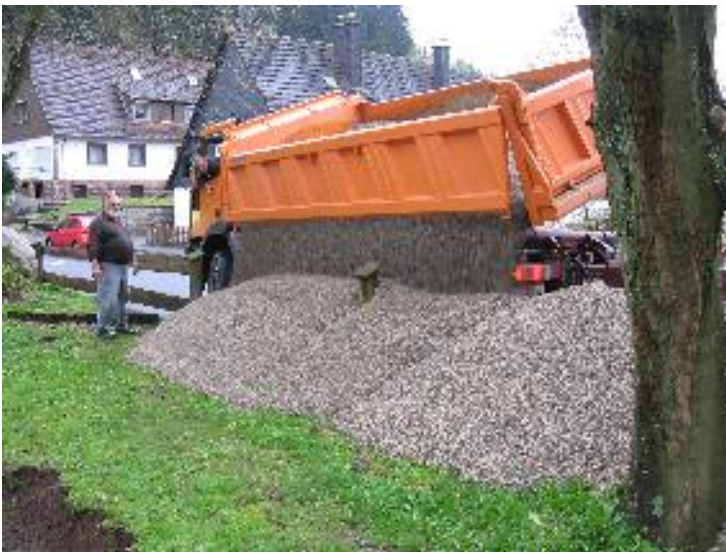
Der Kies wird mit zwei Sattelzügen angeliefert

In der Folge einige „Schnappschüsse“ der gelungenen Aktion.