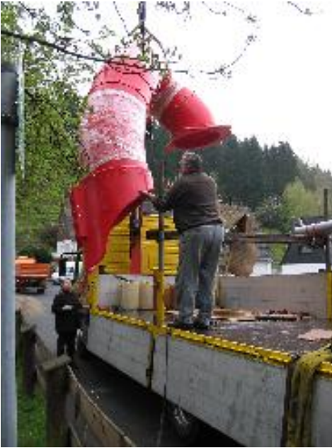
ZEITGLEICH LIEFERTE DIE FA. AUKAM DIE BESTELLTEN GERÄTE