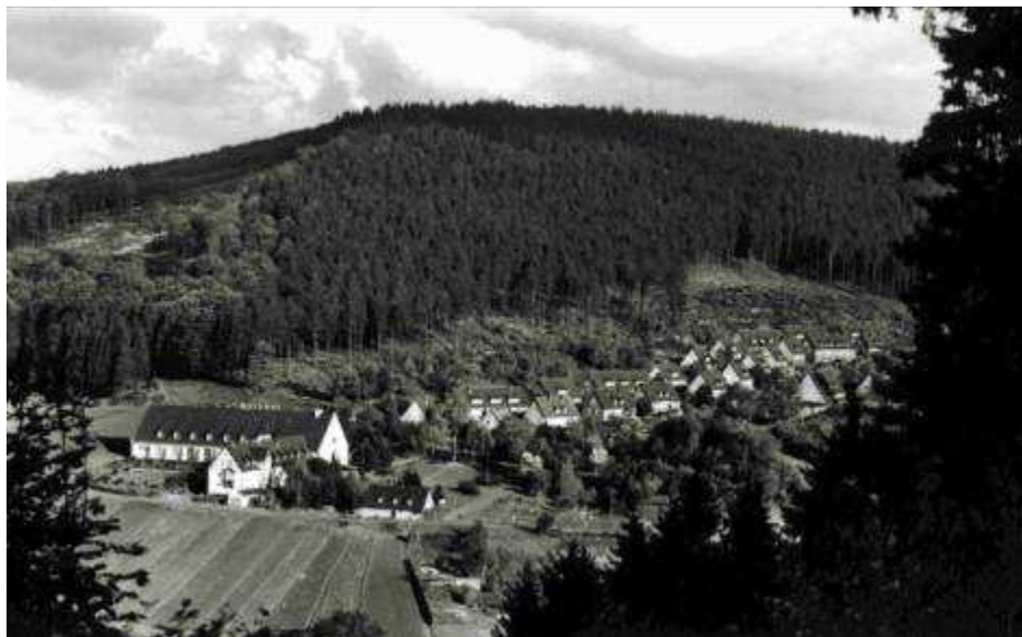
Abbildung 1: Waldhof, aus Richtung Eschenstruth fotografiert.

Huch, schon Oktober, der Herbst naht mit Brausen. Die Tage werden nun merklich kürzer und kälter, die Heizungsanlagen werden gestartet, die warmen Decken aus dem Schrank hervorgeholt.