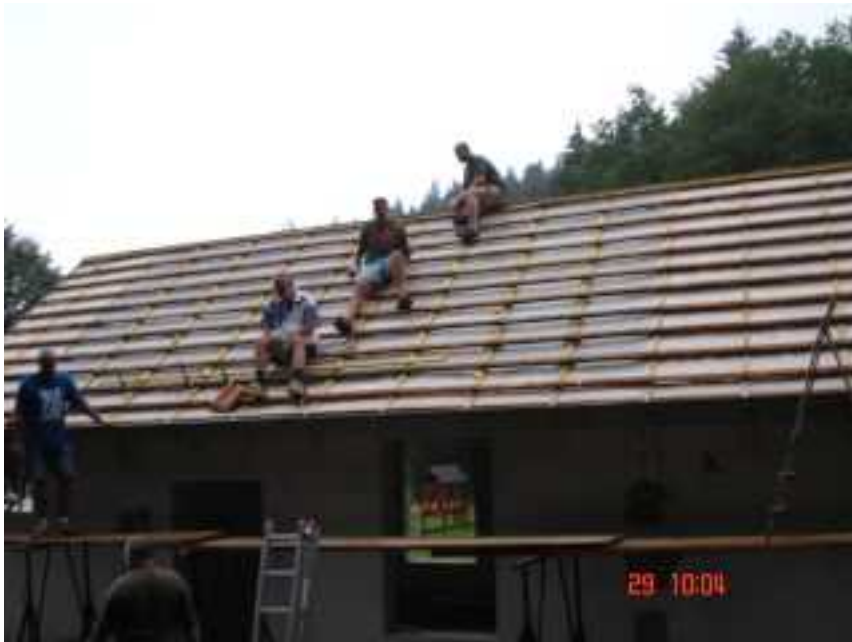
Abbildung 3: Das Eindecken des Daches kann beginnen