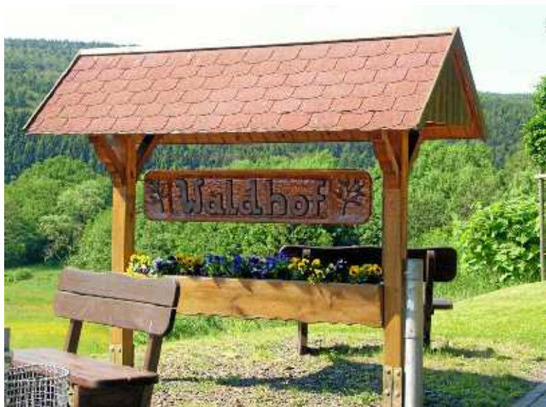
Abbildung 2: Das wieder instand gesetzte Ortsschild

Wir bitten alle Bewohner von Waldhof ihr Augenmerk verstärkt auf diesen Bereich zu lenken. Das für uns zuständige Polizeirevier ist für diesen Bereich bereits sensibilisiert. Für sachdienliche Hinweise, gern auch anonym, sind wir dankbar.