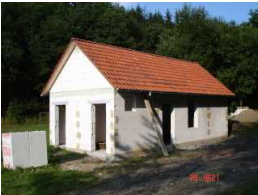
Abbildung 4: Das Dach ist fertig. Damit haben wir eine „trockene“ Baustelle. Jetzt kann in Ruhe mit den Innenarbeiten begonnen werden.