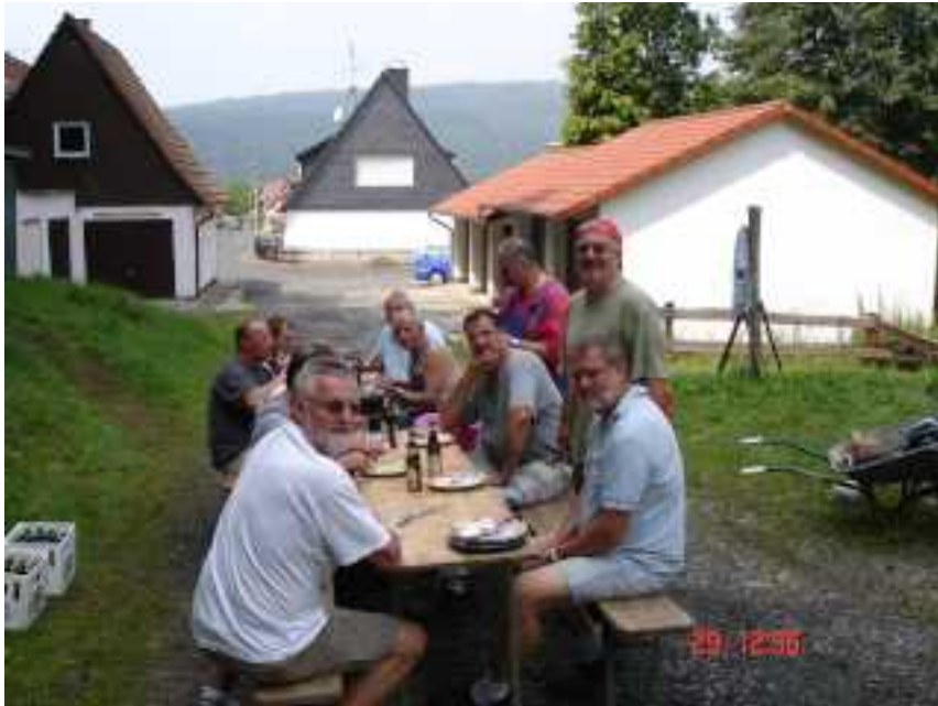
Abbildung 5: Zum Abschluss der Eindeckarbeiten hatten unsere „Mädels“ noch einen kleinen Imbiss vorbereitet, den sich alle schmecken ließen.

Weiterhin möchten wir es nicht versäumen, uns bei den Personen zu bedanken, die uns bis jetzt beim Bau durch ihre Arbeitskraft unterstützt haben: