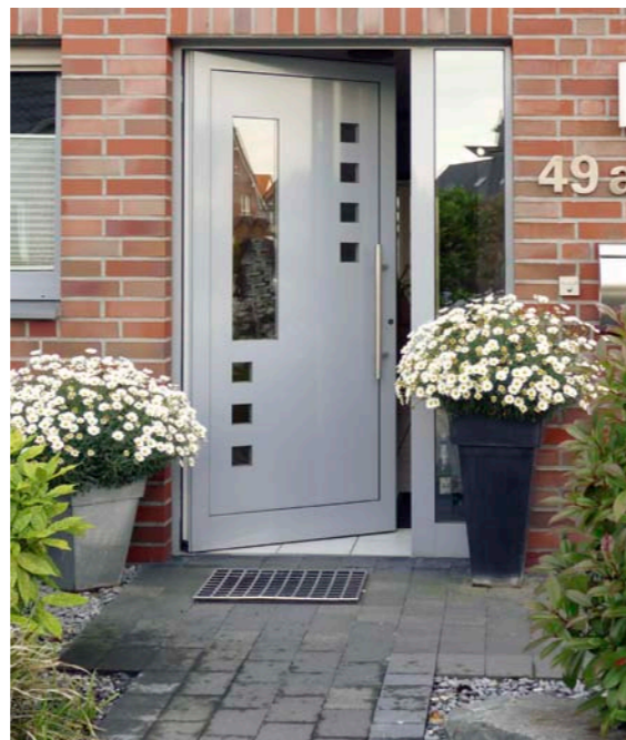
Barrierearm lebt es sich besser.

Die Polizei berät individuell vor Ort zum Thema Einbruchschutz.