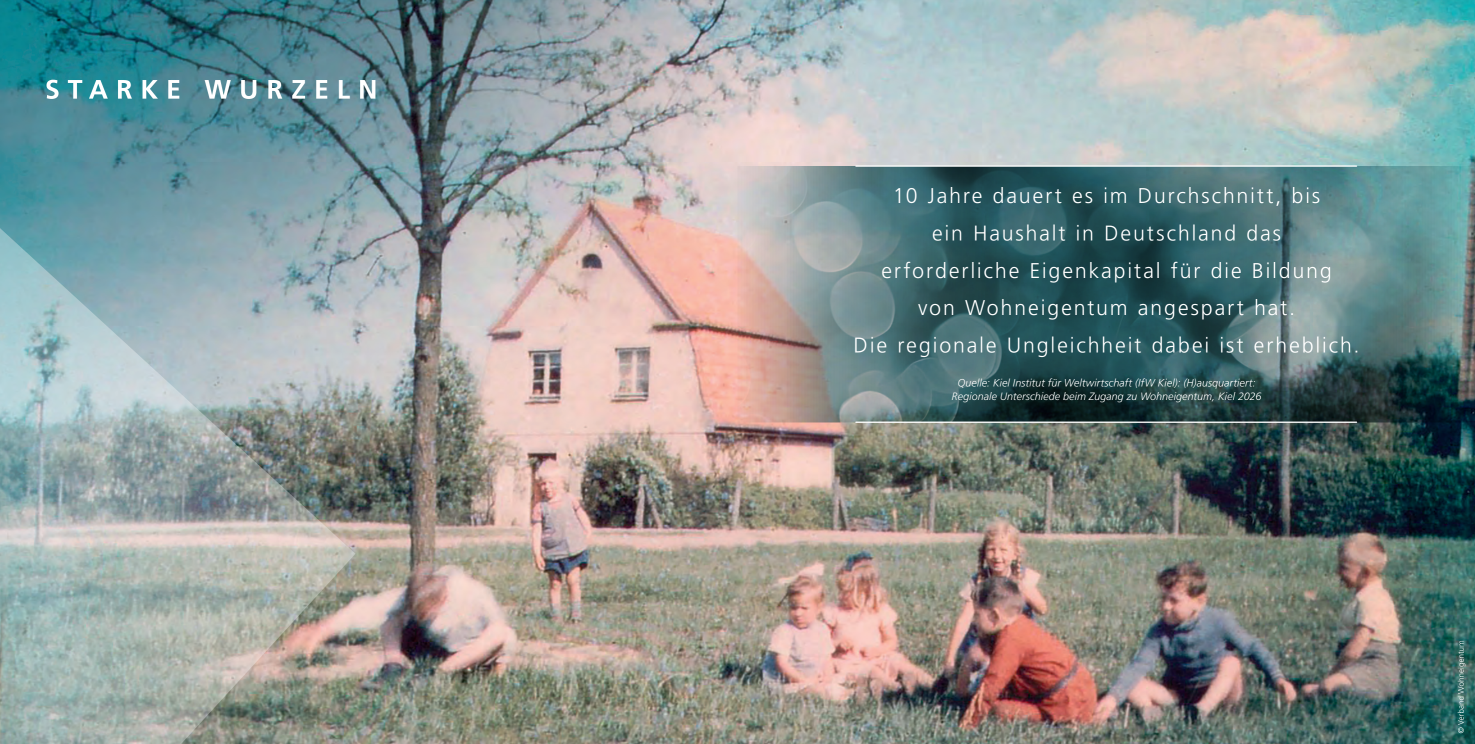
Aufnahme von 1932