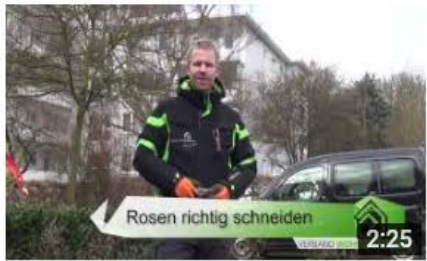
Rosen richtig schneiden – Bodendeckerrosen, Beetrosen, ... 736 Aufrufe • vor 1 Woche