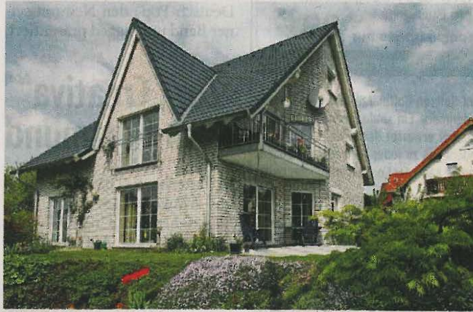
Bei einer Bestandsimmobilie ist das Investitionsrisiko anders gelagert als bei einem Neubau.

Wichtige Vor- und Nachteile beider Optionen