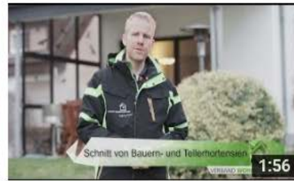
Sträucher richtig schneiden – Schnitt von Bauernhortensie un... 1.340 Aufrufe • vor 3 Wochen