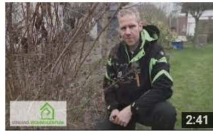
Sträucher richtig schneiden – Schnitt von frühblühenden ... 1.171 Aufrufe • vor 3 Wochen