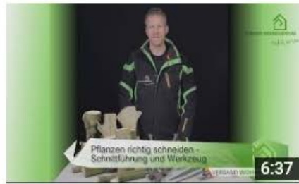
Sträucher richtig schneiden – Schnittführung und Werkzeug 781 Aufrufe • vor 3 Wochen