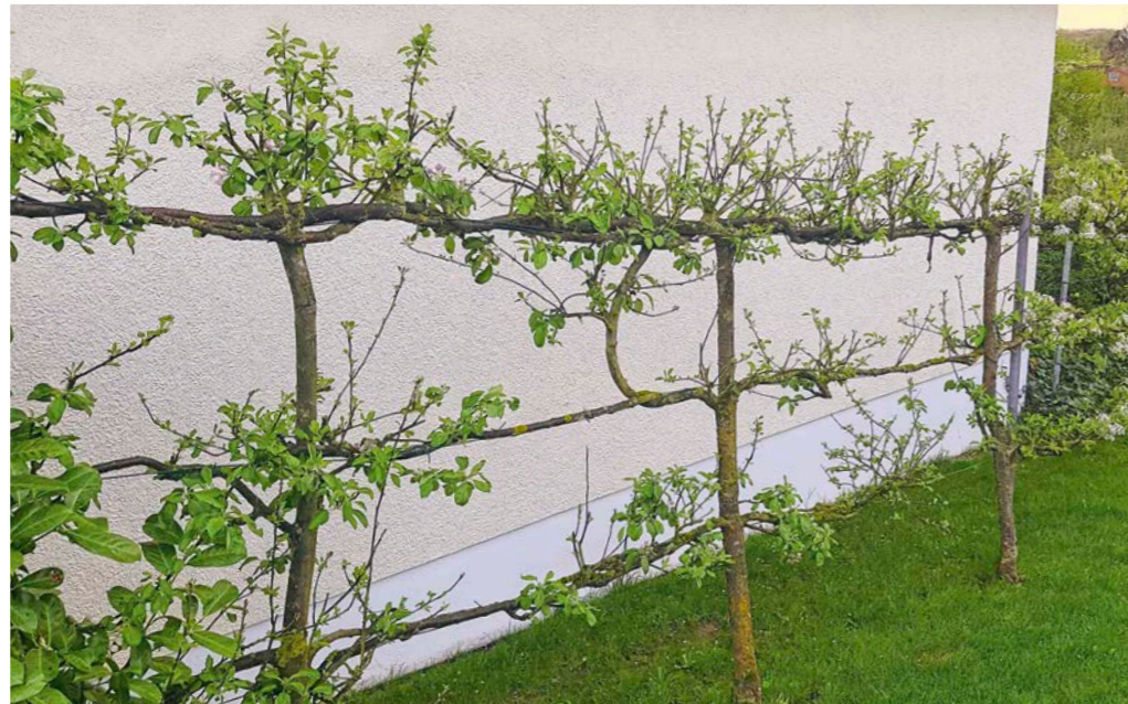
Früchte in greifbarer Nähe: Spalierobst.