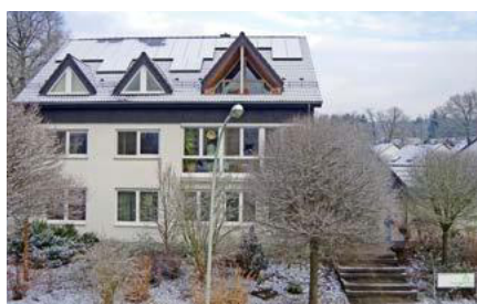
Geschäftsstelle des VWE Hessen

Wegen der Coronapandemie findet die Jubiläumsveranstaltung erst am 05.11.2022 in Verbindung mit dem Landesverbandstag in Frankfurt statt, sodass 2022 zum Jubiläumsjahr wird.