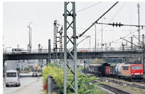
Zuglärm nervt die Anwohner am Bahnhof Waldhof genauso wie Mannheim an 13 weiteren Stellen an den Bahnstrecken im Stadtgebiet.