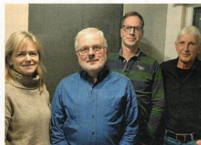
Der neue Vorstand in Mainz-Gonsenheim

Mit neuem Elan möchte der Vorstand die Gemeinschaft nun wiederbeleben und hat sich in seiner ersten Vorstandssitzung am 09.11.2025 zunächst einmal ein Bild über die Struktur des Verband Wohneigentum insgesamt verschafft.