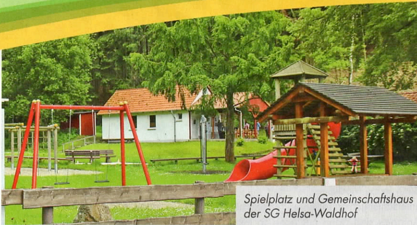
Spielplatz und Gemeinschaftshaus der SG Helsa-Waldhof