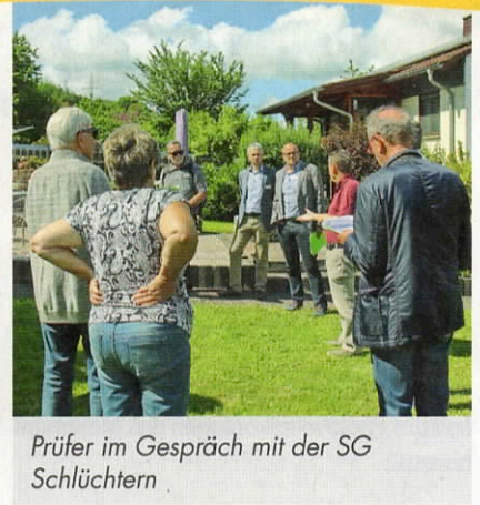
Prüfer im Gespräch mit der SG Schlüchtern