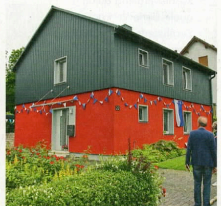
Energieeffizient saniertes Siedlerhaus in der SG Eschwege