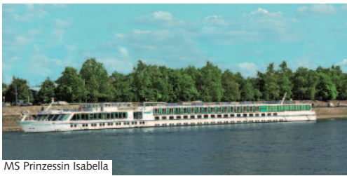
MS Prinzessin Isabella

Die MS Prinzessin Isabella bietet ihren Gästen 4 Passagierdecks, lichtdurchflutete Panorama-Lounge (offene Tischzeit), großzügige Aussichtslounge mit Bar und Tanzfläche, Foyer mit Rezeption, Boutique und Ausflugsbüro, Lift sowie ein großflächiges Sonnendeck mit Liegestühlen, Sitzgruppen und Schattenplätzen. Alle Kabinen liegen außen und sind komfortabel und elegant eingerichtet.