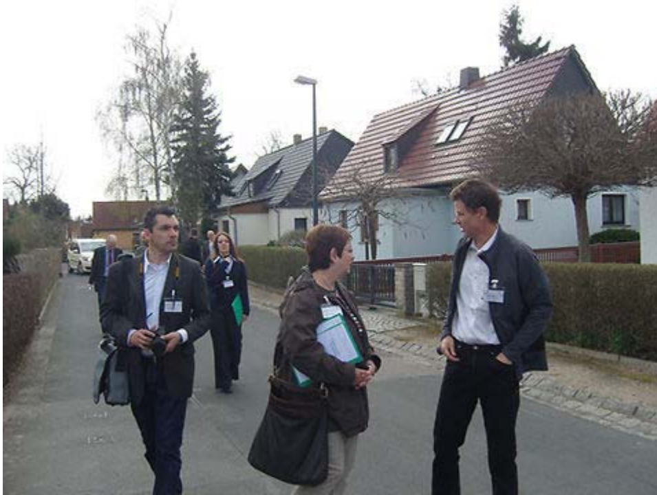
Die Jury bei der Siedlungsbewertung