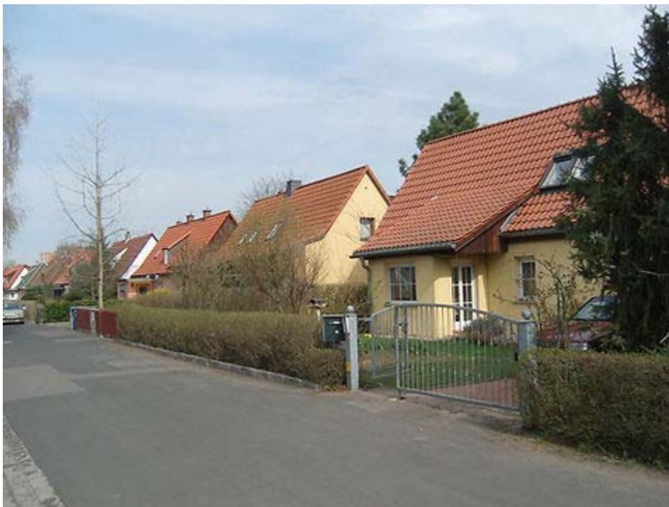
Gepflegte Vorgärten und Häuser bestimmen den Charakter dieser Siedlung