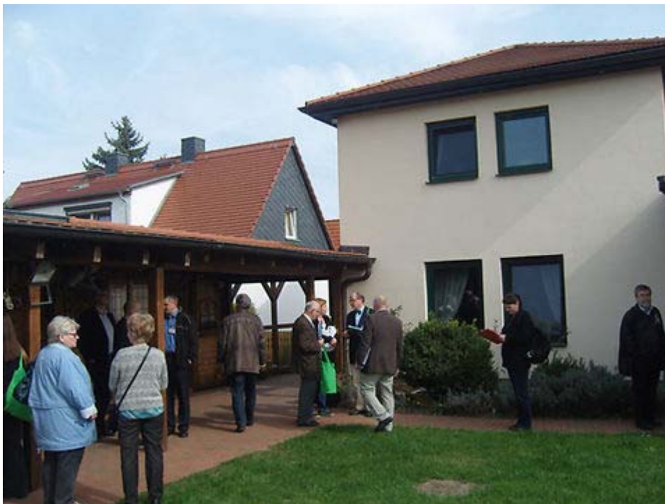
Beispielhafte Lösungen der Energieeffizienz und des altersgerechten Wohnens wurden vorgestellt