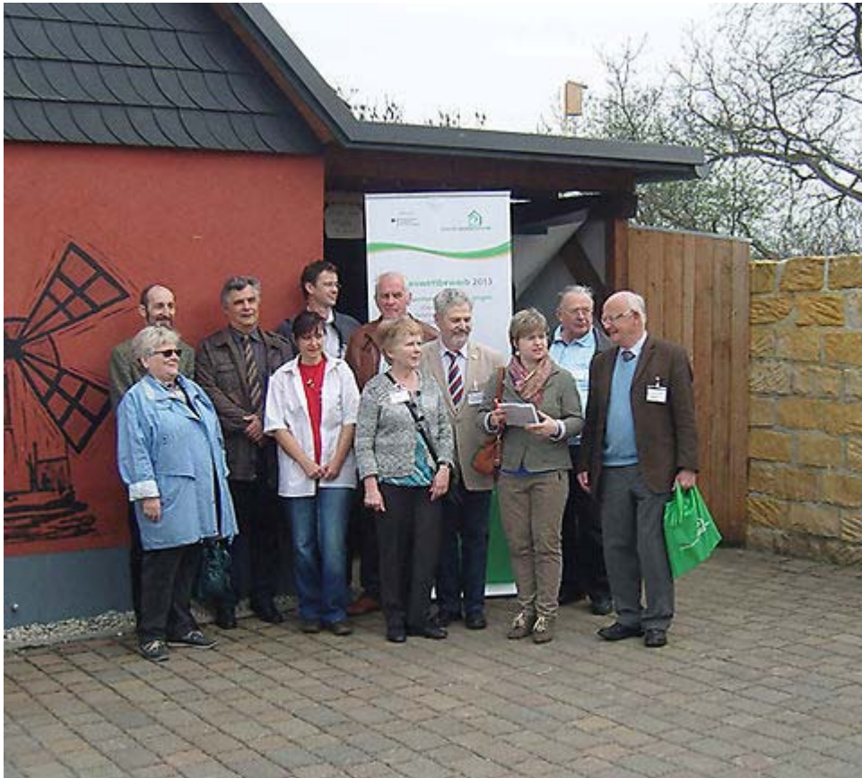
Erinnerungsfoto zum Abschluß vor der symbolischen Windmühle