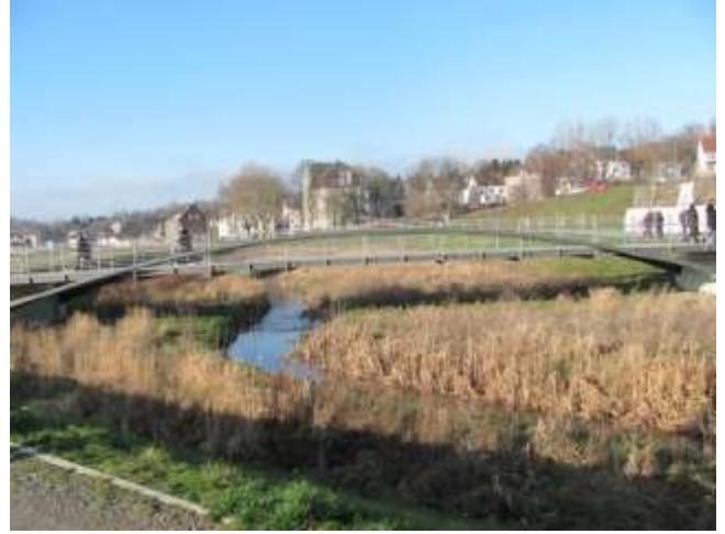
Fußgängerbrücke über die Emscher in Richtung Hörde