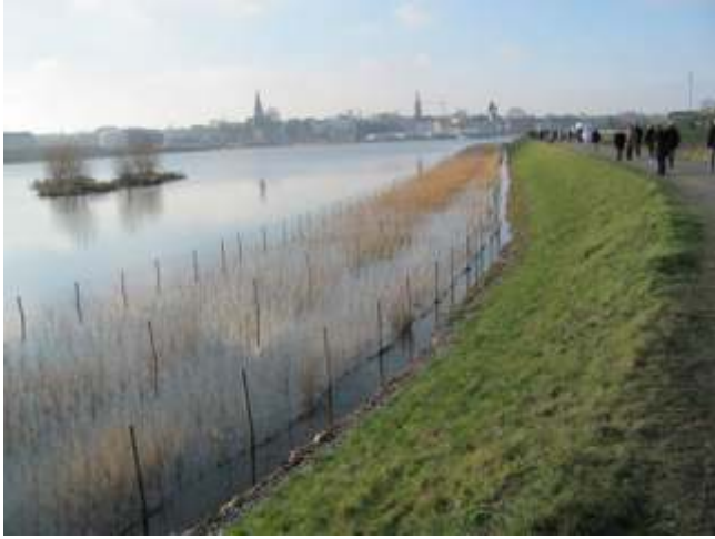
Das Seeufer im Norden mit der wachsenden und noch durch Zäunen geschützter Uferbepflanzung.