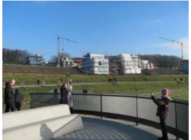
Blick von der Wehranlage Bellevue auf die Neubauten am Seeufer im Norden. Dieses Wehr soll bei Starkwasserereignissen die Emscher stauen und zur Not kontrolliert in den See ableiten.