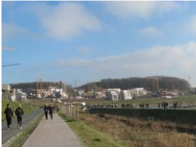
Blick in Richtung Schüren, im Hintergrund die rege Bautätigkeit. Jogger und Spaziergänger registrieren neugierig jede Veränderung.