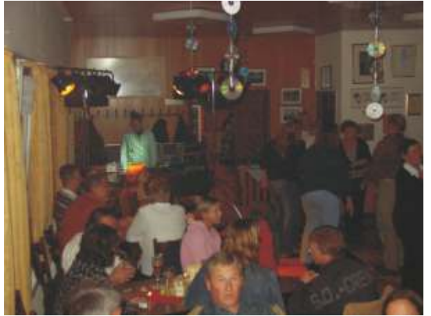
Die Ruhe vor dem Sturm