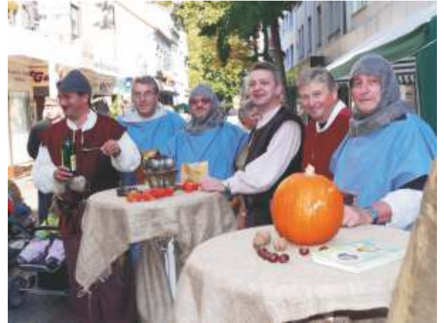
Bereit zur Kostprobe des Burgenkümmels