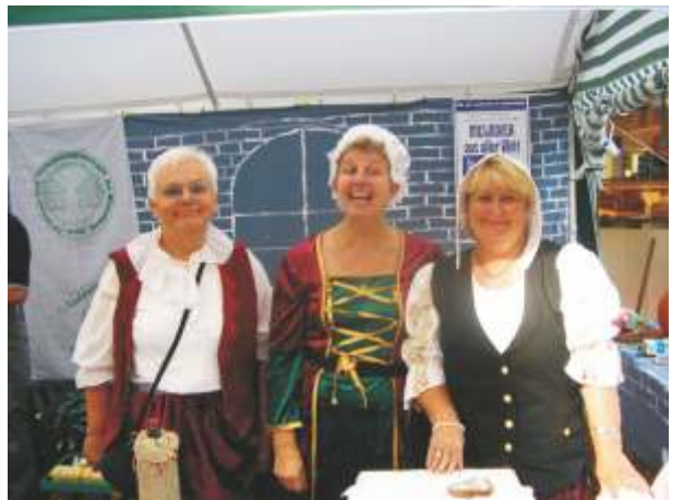
Die Damen unserer Ritter