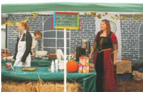
Der Waffelstand wartet auf den großen Ansturm