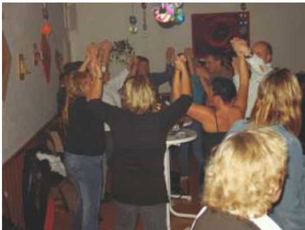
Und die Hände zum Himmel