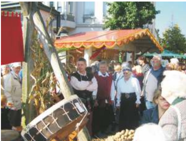
Beobachten ist alles