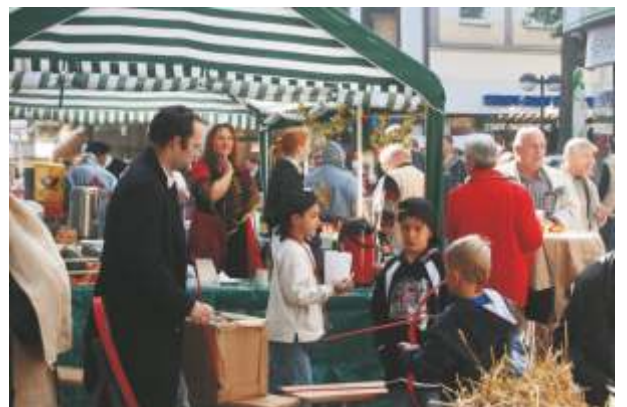
Die "Kleinen" konnten das Bogen- und Armbrustschießen üben