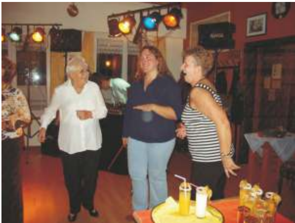
Die 3 Organisatorinnen