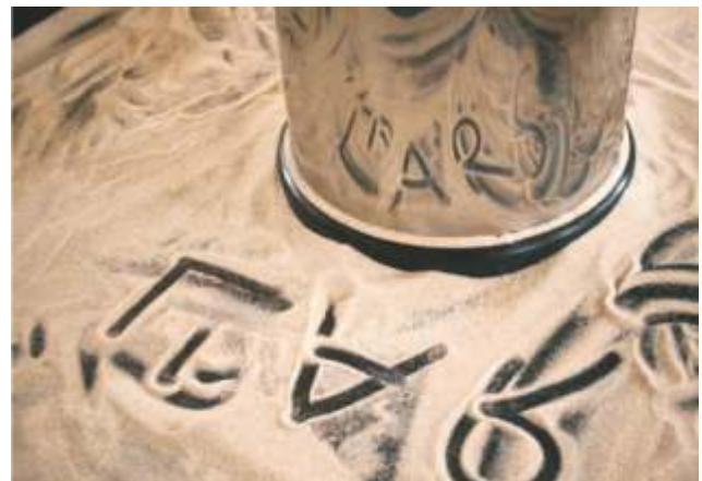
Für die kleinen Entdecker ein Kinderspiel: Ihren Namen in Spiegelschrift in den Sand zu schreiben.