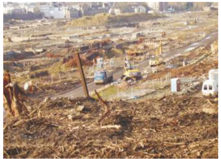
Mit Hochdruck sind Bagger und LKW im Einsatz um freigelegte Stahlteile zu entfernen, die dann als Schrott wieder zu neuem Material verarbeitet werden.