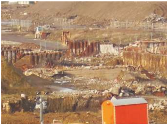
Die Erdschicht ist abgetragen. Die alten Stahlfundamente sind weitgehend von Beton befreit, und müssen noch aus dem Erdreich entfernt werden.