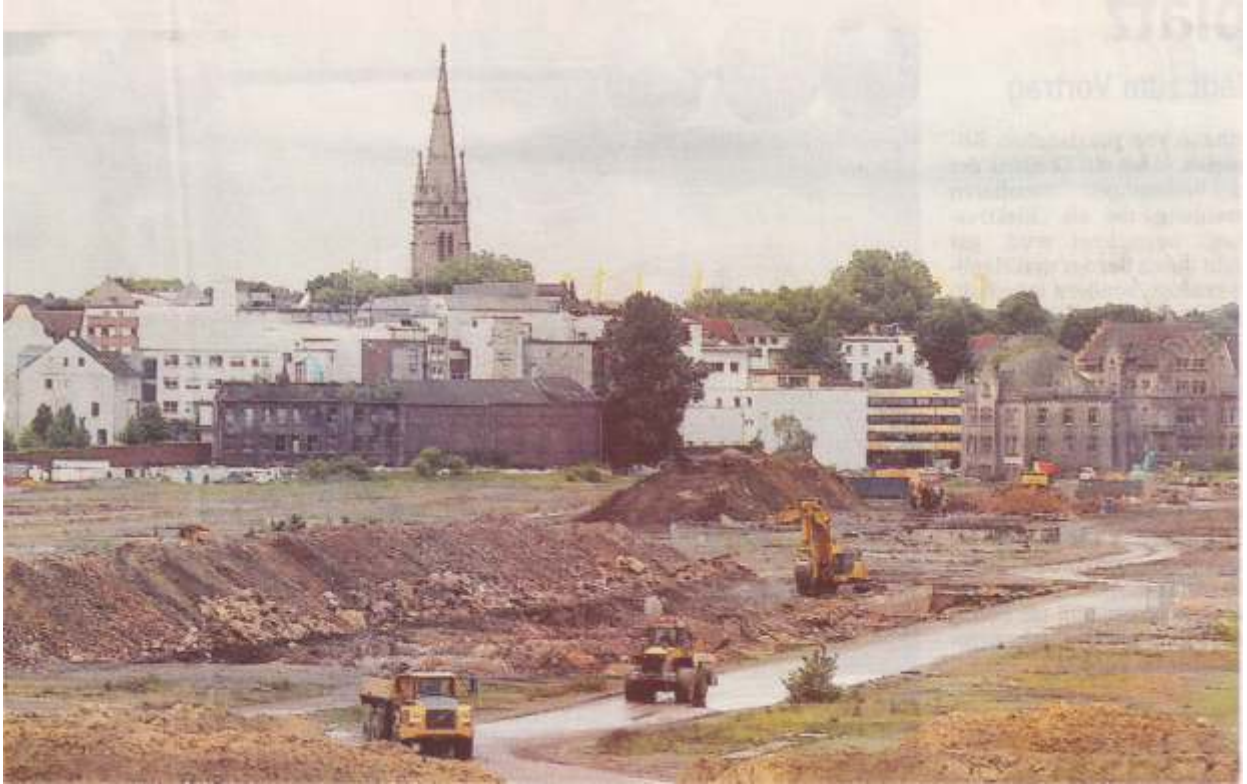
Die See- Baustelle mit Blick auf das Hörder Zentrum und die Stiftskirche. Bagger, Radlader und Muldenkipper bewegen innerhalb eines Jahres 350000 Kubikmeter Erde. Rechts die Hörder Burg