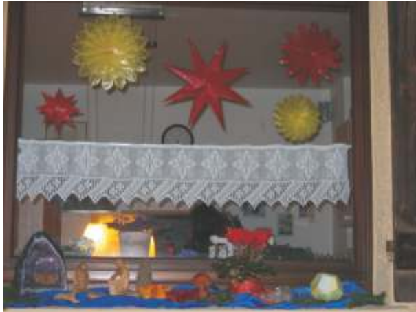
Am zweiten Advent war das Thema: Sterne