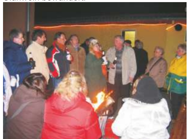
Bei offenem Feuer wurde die Kälte und der Wind überbrückt.