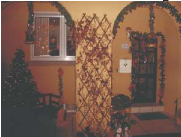
Am Ersten Advent war das Thema: Baum