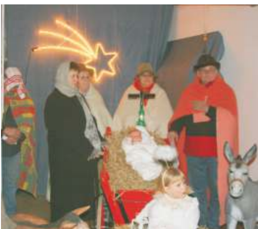
Am vierten Advent war das Thema: Die Weihnachtsgeschichte