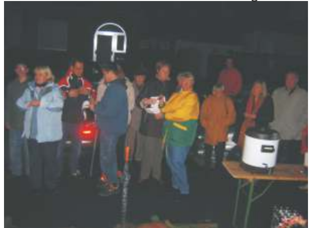
Das Sternfenster wurde bei Würstchen und Glühwein bewundert.