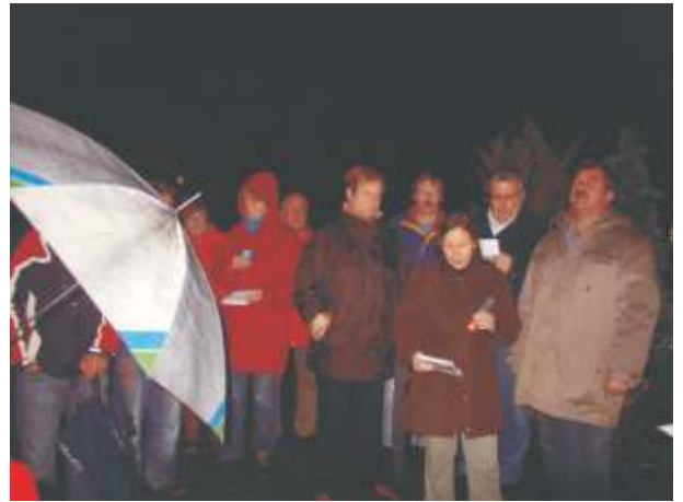
Wegen Regen und Sturm wurde das Beisammensein ins Gerätehaus verlegt.