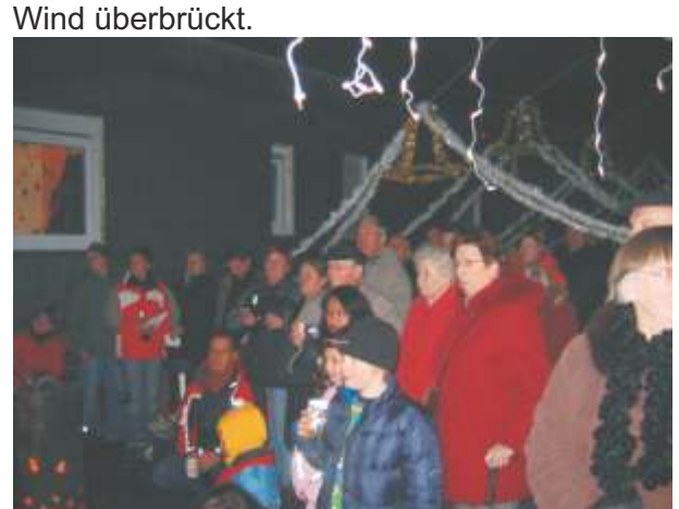
Ca. 60 Siedler und Gäste haben sich beim letzten Fenster auf Weihnachten eingestimmt.