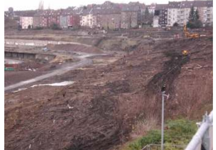
Ein Blick vom Infopoint zum Remberg.

Nach Auftragsvergabe werden die Arbeiten fortgesetzt. Die Böschungen am früherem Schürener Tor sind weitgehend von Bäumen befreit. Teilweise sind Mauern und Fundamente frei gelegt. In den nächsten Monaten werden im Umfeld der Afflerbach-Halle und an der Faßstraße weitere Gebäude abgerissen.