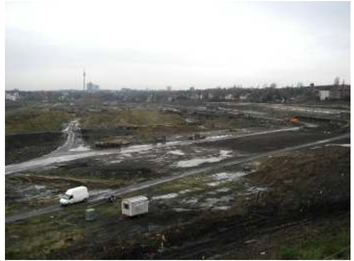
Ein Blick auf das Phoenix-See-Gelände im November 2007.

Die Arbeiten sind weitgehend eingestellt, nach dem Abtransport von hunderttausenden Kubikmetern auf das Phoenix- West Gelände. Anfang Dezember rollen die Bagger auf dem Phönix-See-Gelände. Sie sollen dann die rund 2,3 Millionen Kubikmeter Aushub ans Tageslicht fördern.