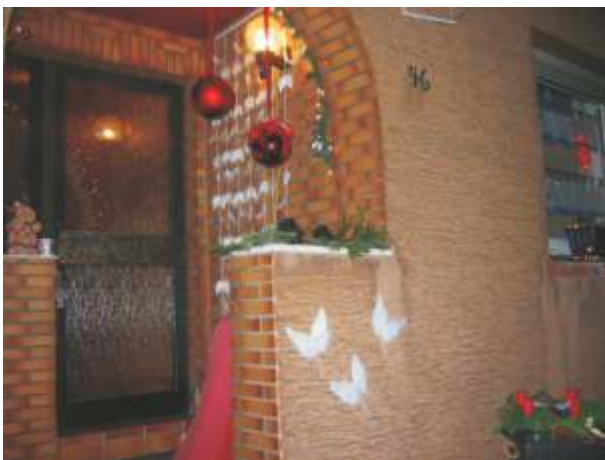
Am dritten Advent war das Thema: Engel