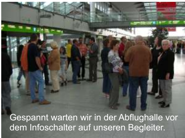
Gespannt warten wir in der Abflughalle vor dem Infoschalter auf unseren Begleiter.

Und als dann noch die Privatmaschine des FIFA-Präsidenten Sepp Blatter landete, fuhr unser Sightseeing Bus in nur 10 Metern Abstand an dem kleinen Schweizer vorbei, der uns zuwinkte.