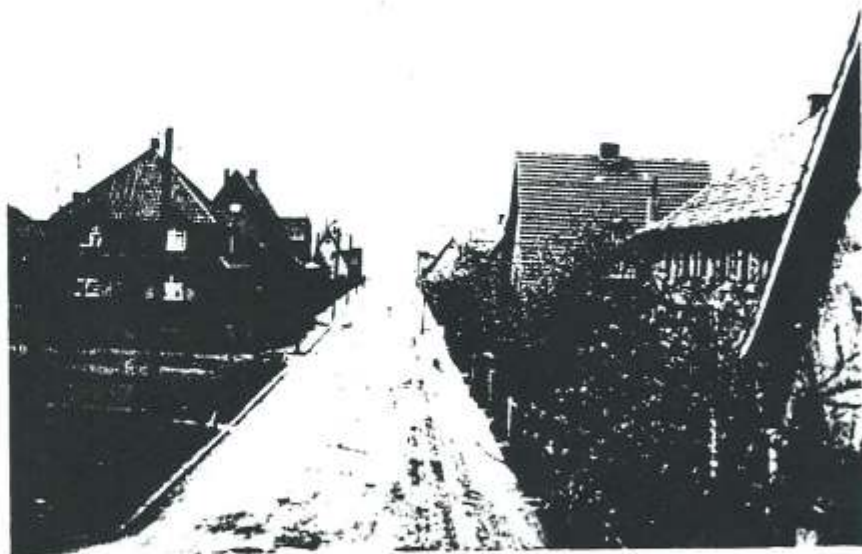
Der obere Sommerberg um 1930. Mit den Häusern 25 - 89 und dem heutigen Kinderspielplatz - damals

In den Jahren 1925 - 1926 wurden die ersten Gaslaternen aufgestellt, die erst in den 50-er Jahren durch die noch vorhandenen elektrischen Peitschenleuchten ersetzt wurden. Alle Häuser hatten 4 Zimmer, Bodenraum und Keller, sowie teilweise einen angebauten Stall und eine Düngergrube. Die Wohnfläche betrug ca. 70 qm. Hinter den Häusern befand sich Gartenland.