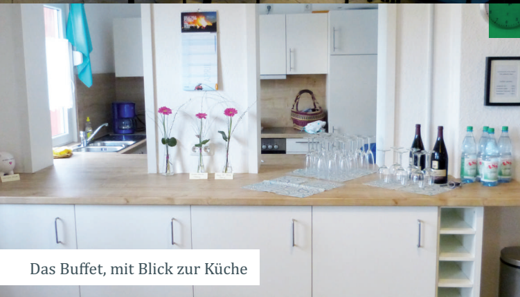
Das Buffet, mit Blick zur Küche