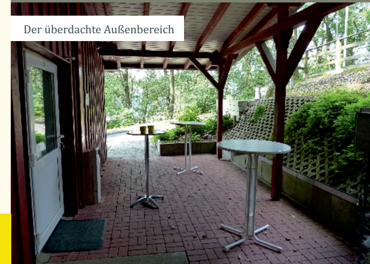
Der überdachte Außenbereich