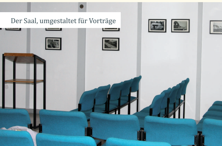
Der Saal, umgestaltet für Vorträge

Unsere Adresse: Siedlergemeinschaft Auf der Meinhardt e.V. Auf der Meinhardt 92 57076 Siegen / Weidenau