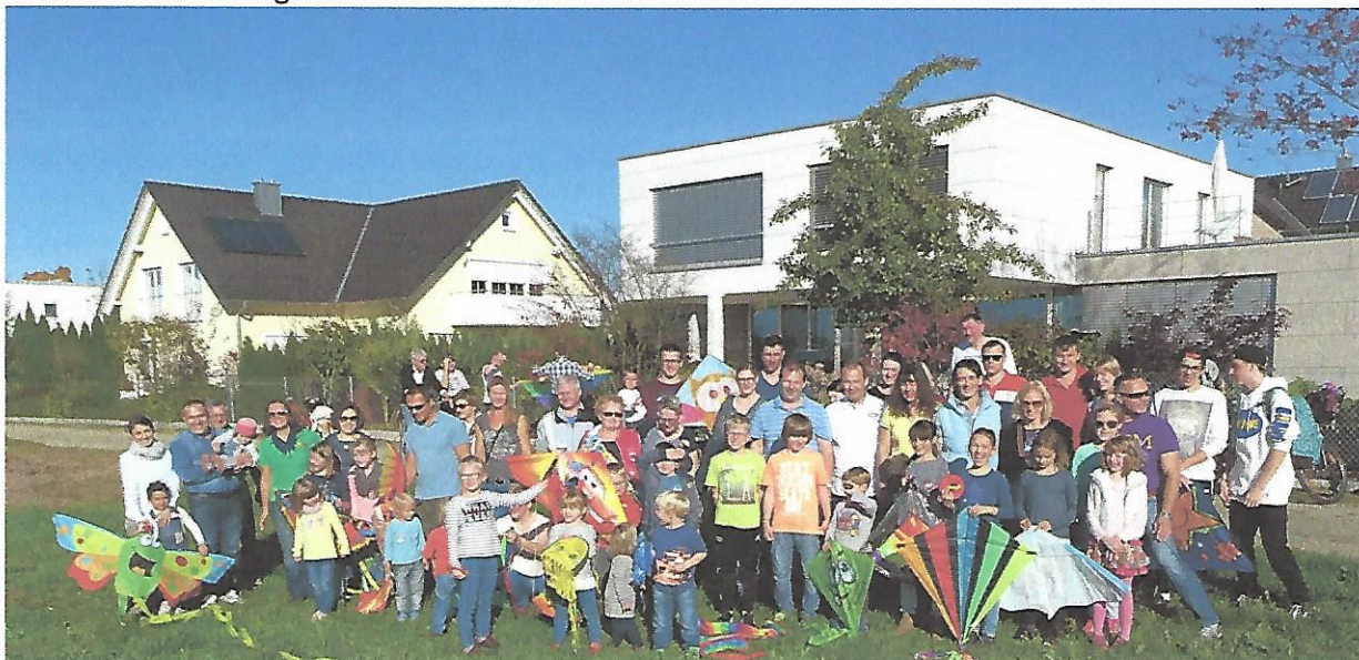
Text und Bild: Dobmeier

Vielen Dank an Klaus Kamm für die angespitzten Haselnussstecken und an die Familien Friedrich-Käus und Lukas für den Stockbrotteig.