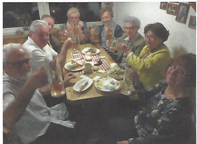
Bilder und Text von Claus Schramm