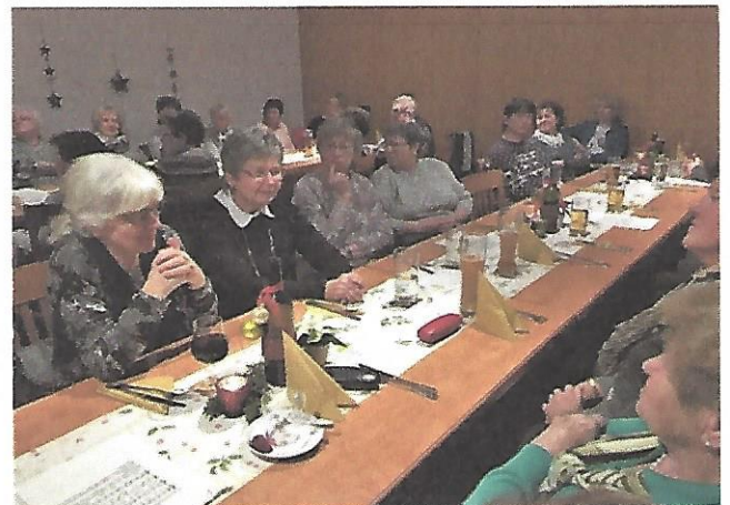
Bilder und Text: Edith Nicklas