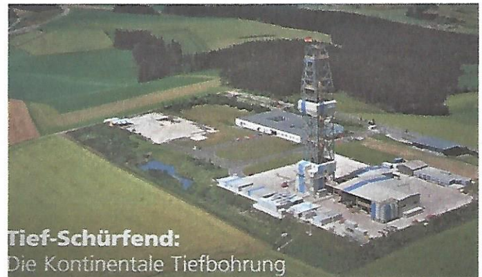
Tief-Schürfend: Die Kontinentale Tiefbohrung

Über 300 Geowissenschaftler, 150 Arbeiter (im Schichtdienst) bohrten hier 9.101 m tief in den harten, kristallinen Festgestein der oberpfälzischen Erdkruste;