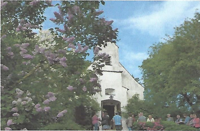
Die Kapelle war wieder einmal übertoll mit Krumpes-Siedlern