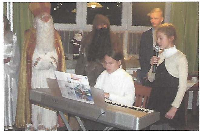
Bilder und Text: Hubert Lukas