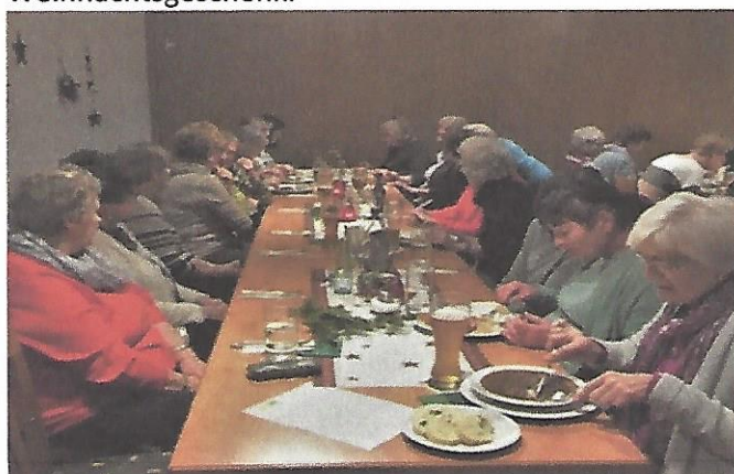
Bilder und Text: Edith Nicklas

Einmal im Jahr Viel zu selten – einmal im Jahr, wird es mancherorts wie es früher war: im Warmen sitzen, zusammen, daheim, das kann nur die Weihnachtszeit sein. Einander zuhören, miteinander reden und lachen, für Vieles danken und neue Pläne machen. Streit und Sorgen sind im Moment so fern, auf Frieden und Liebe hofft jeder gern. Ich wünsche Euch solche Tage – eine solche Zeit und Für das neue Jahr Gesundheit und Zufriedenheit. Eure Edith Frauenbeauftragte