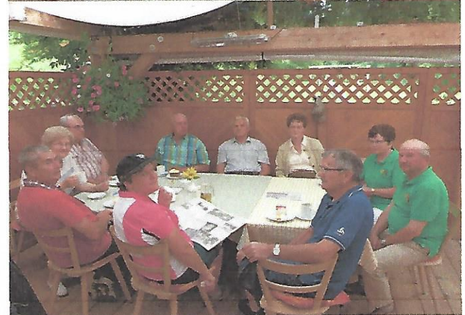
Text und Bilder: Claus Schramm