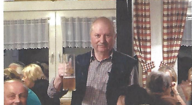
Text und Bilder: Claus Schramm