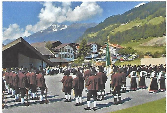
Empfang im Stubaital - 2012