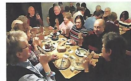
Bilder und Text: Claus Schramm