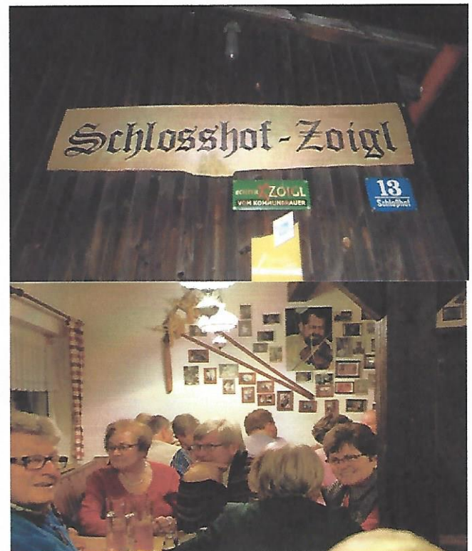
Bilder von Jakob Sperrer