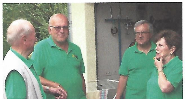
Freude bei der engeren Vorstandschaft über den guten Besuch Text u Bilder: Hermann Legat