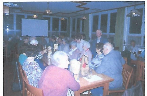
Text und Bilder: Doris und Hubert Lukas