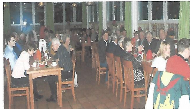
Text und Bilder von Hubert Lukas

Hinweis: Diesem INFO liegt der Siedlerkalender 2023 bei – eine erste Termin-Vorschau !