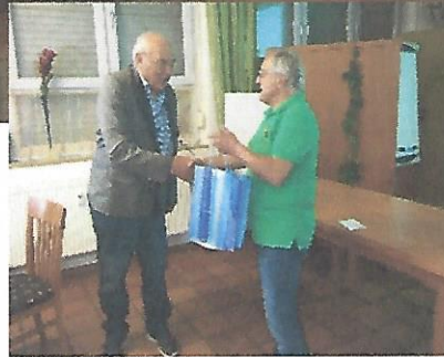
Text und Bilder: Gerhard Götz