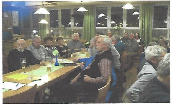
Text und Bilder: Hubert Lukas