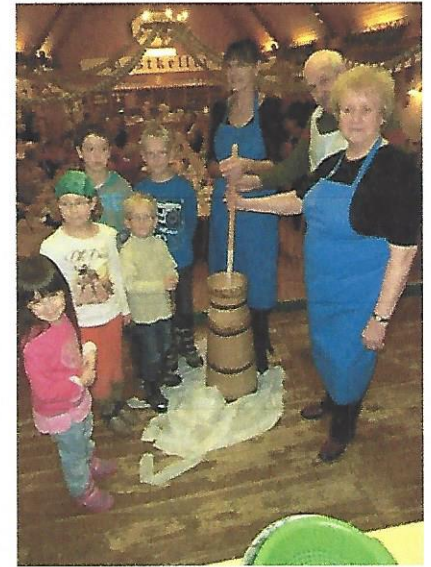
Bilder und Text: Hubert Lukas