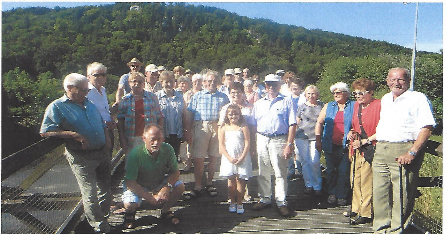
Text und Bild: Claus Schramm

Das Abschlussziel hatte Erich Bäumler zunächst geheim gehalten, Überraschung gelungen: ein wunderschöner Landgasthof in Oberleinsiedl, einem Ortsteil von Ursensollen, erwartete die bereits wieder Hungrigen und Durstigen. Ein schöner Tag klang aus; welches Wetterglück beschert war, merkte man eine Stunde später zuhause, ein kurzes, aber kräftiges Unwetter jagte die Hitze hinweg und verschaffte, neben Aufräumarbeiten im Garten, einen erholsamen Schlaf, bei angenehmer Temperatur.