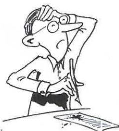
Habe wieder fertig!!!