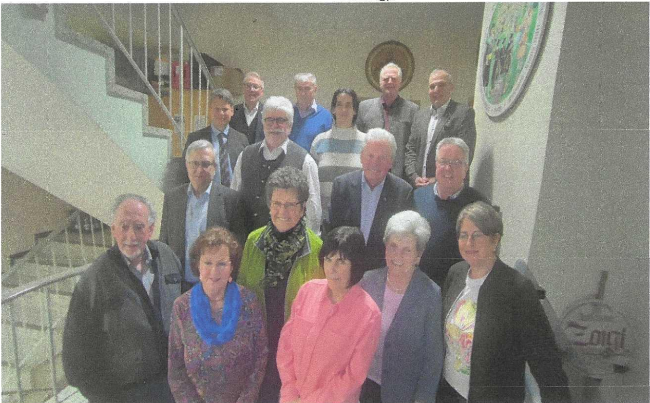
Hier die neue Vorstandschaft mit den Ehrengästen